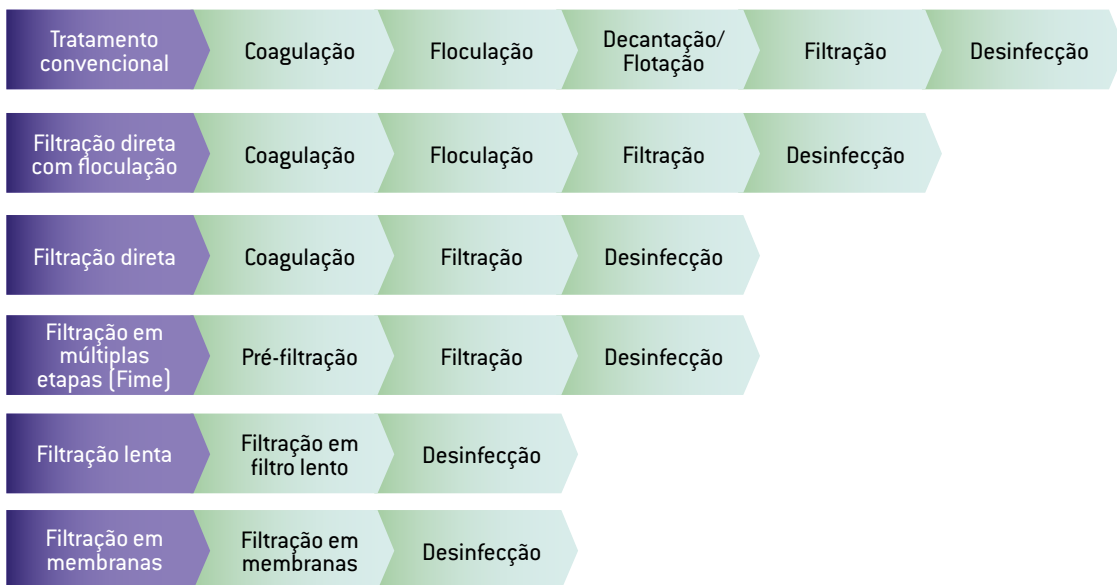
Figura 2 – Técnicas mais usuais de tratamento de água para abastecimento público